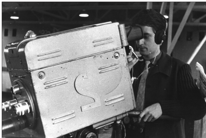
1968 m. Žvilgsnis pro TV kameros akį.

džiaga tik „atstumiamo“ ir laida daroma abejingai, be didesnės pagarbos žiūrovui, tuomet bukina jį, neperteikdama nei dvasinių vertybių, nei sukurdamą naujos pridėtinės vertės.