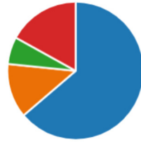
2 pav. Anketos klausimas ir pasirinktų atsakymų distribucijos vizualizacija; n = 47 .

Uždaras klausimas / Atsakymų distribucijos grafinė vizualizacija