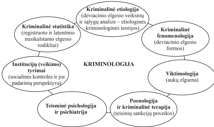
1 pav. Kriminologijos sritys 31

Pagrindinės kriminologinių tyrimų sritys vaizduojamos 1 paveiksle.