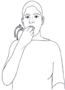
1 pav. Ikoniškas gestas VALGYTI