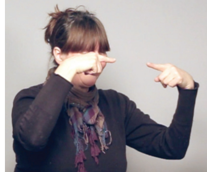
23 pav. Metafora kūrinyje „Kurčias žmogus“