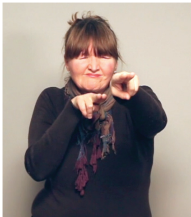
4 pav. Orientacinė metafora. Kūrinys „Sapnas“