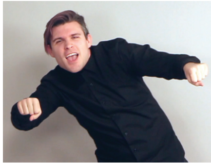
14 pav. Praeities metafora (kairė pusė)