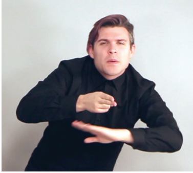
13 pav. Praeities metafora (dešinė pusė)