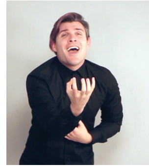
15 pav. Praeities metafora (dešinė pusė)