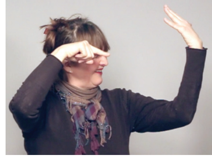
20 pav. Metafora kūrinyje „Kurčias žmogus“