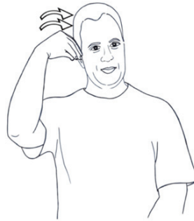
2 pav. Ikoniško gesto metaforiškas vartojimas perteikiant abstrakčios sąvokos veiksmą. Gestas MOKYTIS