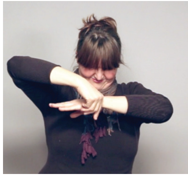
11 pav. Augantis medis, rodomas centre. Kūrinyje „Kurčias žmogus“