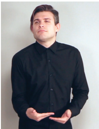
16 pav. Dabarties metafora (centras)