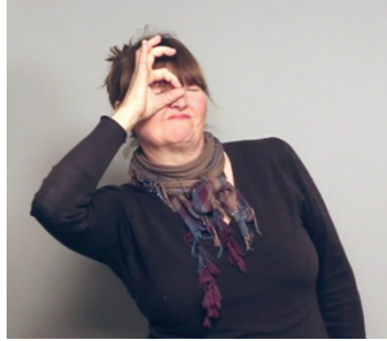
19 pav. Proforma, žyminti akį. Kūrinys „Kurčias žmogus“