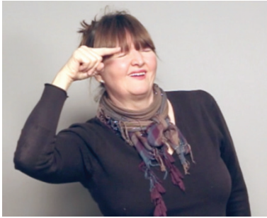
18 pav. Metafora, kuriama prie akies. Kūrinys „Kurčias žmogus“