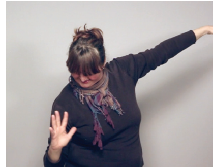
8 pav. Orientacinė metafora. Kūrinys „Kurčias žmogus“

skirtingą statusą (žr. 8 pav.). Kurčioji poetė vanago skrydį ir jo ore ištiestą sparną rodo aukščiau (poetės kairė ranka) nei vėjyje siūbuojantį medį (dešinė ranka). Kitaip tariant, skirtingomis rankomis rodomi gestai erdvėje išdėstomi skirtinguose aukščiuose – taip nebūtinai būtų kitame kontekste – ir tai byloja apie skirtingą šio kūrinio veikėjų tarpusavio galią.