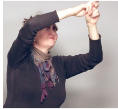
12 pav. Vanago skrydis, rodomas šone. Kūrinyje „Kurčias žmogus“