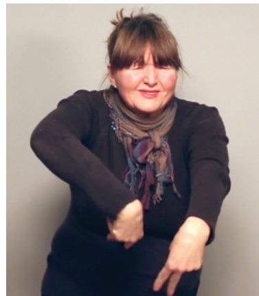
5 pav. Orientacinė metafora. Kūrinys „Sapnas“

Minėtais atvejais LGK poetai vartoja teorinėje dalyje aptartus polisintetinius gestus: mergaitę atstumia tėtis, medžiotojas taikosi šautuvu, kiškiai laksto po pievą, liuoksi vienas per kitą . Pasvirusiu šriftu pateiktus veiksmožodžius kurtieji poetai tiesiog susikuria poezijos kūrinuose, o pasitelkę gesto loka-