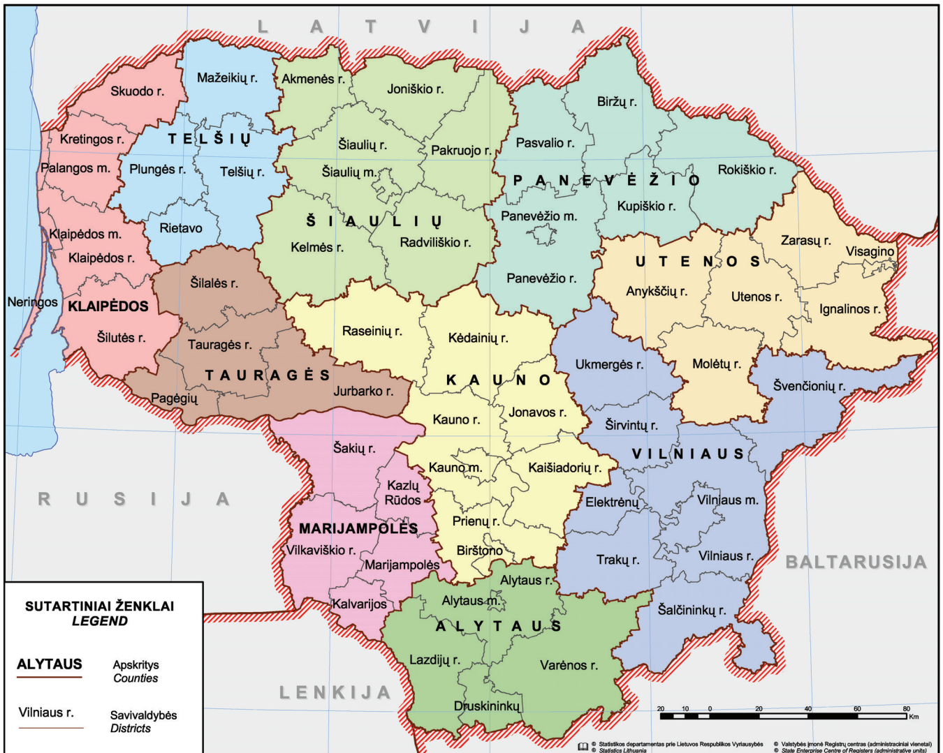
1 pav. Lietuvos Respublikos teritorijos administracinis suskirstymas

miestų planavimo klausimus. LSSR vyravo teritorinio planavimo tikslas – priartinti kaimą prie miesto, jis gana aiškiai buvo išreikštas 1964–1967 m. sudarytoje pirmojoje gamybinių jėgų išdėstymo ir urbanizavimo schemoje, pramonė buvo telkiama ne tik didžiuosiuose miestuose, bet ir kuriami nauji pramonės centrai (pvz., Alytus, Mažeikiai) ir net nauji miestai buvusiose kaimo vietovėse – Naujoji Akmenė, Elektrėnai, Visaginas. Dėl sovietmečiu vykdytos teritorijų planavimo politikos Lietuva ir šiuo metu pasižymi tankiu ir tolygiu miestų tinklu. Deja, yra ir nemažai dirbtinai suformuotų industrinių centrų, kurie pasikeitus ekonominei situacijai, o masto ekonomiką pakeitus poreikiui diversifikuotis ir išnykus daliai anksčiau prieinamų rinkų, susidūrė su rimtomis socialinėmis ir ekonominėmis problemomis.