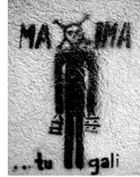
2 pav. Trafaretų menas, atspindintis antivartotojiškas idėjas. Vilnius, 2008.

Taigi dažniausiai pankų subkultūroje vykstanti veikla yra savanoriška, pelno neteikianti veikla. Jei tradiciškai įvairūs darbai oficialiai įforminti, dirbantiems asmenims sumokama,