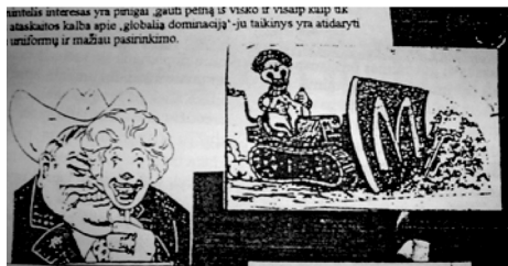
3 pav. Fragmentas iš žino „Kontra“, 2001, Nr. 3. Idėjos, atspindinčios antivartotojiškas nuostatas. 2008.