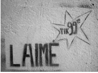
1 pav. Trafaretų menas, atspindintis antivartotojiškas idėjas. Vilnius, 2008.

Vartotojiškai, komercializuotai kultūrai prieštaraujanti „pasidaryk pats“ etika įkūnija žmogaus troškimą sutelkti jėgas savirealizacijai. Bet kokia minėtais principais grįsta veikla pankų subkultūroje įgalina ja užsiimančius asmenis pasijusti stipresniais, nepriklausomais (kiek tas įmanoma) nuo tokių išorinių sąlygų kaip pinigų kiekis (kas tarsi suteikia laisvę), pažintys su ekonomiškai ar politiškai įtakingais asmenimis (šiuo atveju pažintys dažniausiai neperžengia subkultūros ribų, bet pati subkultūra peržengia kitokias ribas, pvz., valstybės, kalbos ir pan.).