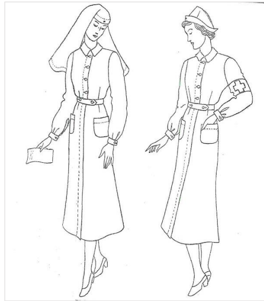
1 pav. Suknelė darbui.

Higieniška, praktiška, atitinkanti darbo reikalavimus, šviesiai mėlynos spalvos. Sijonėlis į apačią kiek platesnis, dvi kišenės. Suknelė priekyje susegama baltomis perlamutro sagomis. Diržas tokios pat medžiagos, susegamas dviem sagomis. Medicinos seserys, dirbančios operacinėse, gali dėvėti suknelę trumpomis rankovėmis, prie kurių, esant reikalui, galima būtų prisegti ilgas. Balta apskrita skarytė ne ilgesnė kaip 75 cm, rišama užpakaly, atlenkta 3 cm kraštais, priekyje įsegtas mažas metalinis Raudonojo Kryžiaus ženklas. Kojinės baltos arba pilkos, batai balti arba juodi, pakulnė ne aukštesnė kaip \frac{3}{4} , pakalta guma. Ant suknelės dėvimas baltas chalatas.