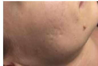
2 pav. 1-os tyrimo dalyvės randai po aknės prieš procedūrų kursą

Po pirmos procedūros su „X“ kompanijos produktais tyrimo dalyvės oda atrodė švaresnė, skaistesnė, susitraukusios, švaresnės poros, atsigavęs odos atspalvis, kaktuje matomos sumažėjusios mimikos raukšlės. Tačiau sumažinti randų, kurie tyrimo dalyvei kelia didelį diskomfortą, matomumui vienos procedūros neužteko, taigi buvo priimtas sprendimas atlikti glikolio rūgšties procedūras kas 7–10 dienų ir jas pakartoti 4 kartus (1 ir 2 pav.).