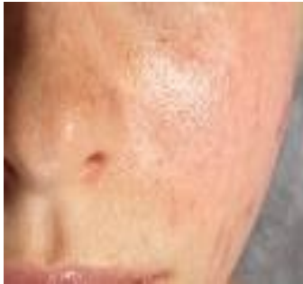
4 pav. 2-os tyrimo dalyvės veido odos būklė prieš procedūrų kursą