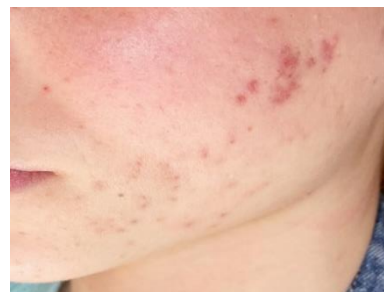
7 pav. 2 tyrimo dalyvės veido odos būklė po keturių procedūrų

Pagal tyrimo duomenis nustatyti 2-os tyrimo dalyvės odos pokyčiai pateikti 3 lentelėje.