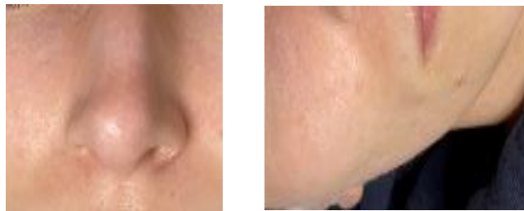
3 pav. 1-os tyrimo dalyvės veido odos būklė po keturių procedūrų kurso

Per ketvirtą procedūrą vizualiai vertinant odos būklę, nustatyti odos pokyčiai: oda įgavusi vientisumo, skaistesnė, išsivalė uždaro ir atviro tipo komedonai, nėra bėrimų, po prausimosi nejaučiama odos tempimo, sumažėjęs blizgėjimas T zonoje (3 pav.).