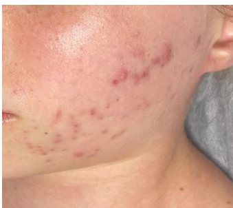
6 pav. 2-os tyrimo dalyvės veido odos būklė prieš pirmą procedūrą

Po keturių procedūrų skruostų srityje buvo skausmingi uždegiminiai bėrimai, ryškesni randeliai. Odos spalva įgavusi vientisumo, atkurta drėgmė, neliko odos tempimo jausmo po prausimosi, sumažėjo atvirų ir uždarų komedonų, poros švaresnės, oda švelnesnė, nebešerpetoja (6, 7 pav.).