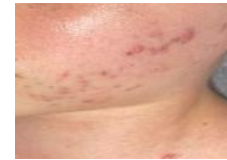
5 pav. 2-os tyrimo dalyvės probleminė veido odos sritis

2-ai tyrimo dalyvei po pirmos procedūros su glikolio rūgštimi vizualiai matomas lengvas odos būklės pagerėjimas. Dalis komedonų nosies ir smakro srityse išsivalė, taigi oda atrodo švaresnė ir skaistesnė. Taip pat sumažėjo papulių ir pustulių dydis, pakito jų spalva. Po pirmos procedūros nustatyta, kad vienos procedūros nepakaks išspręsti esamas odos problemas. Siekiant efektyvesnio poveikio, 2-ai dalyvei buvo rekomenduota atlikti bent 4 procedūrų kursą kosmetologo kabinete kas 7–10 dienų, o procedūrų tęstinumui namuose naudoti rekomenduotas kosmetines priemones su glikolio rūgštimi.