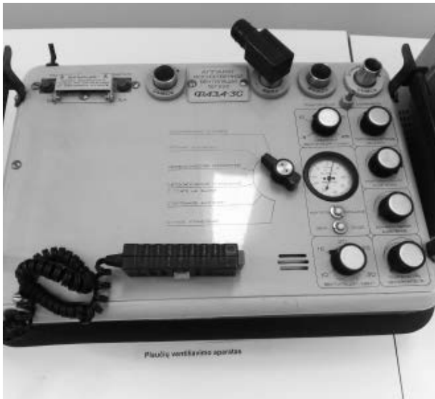
Plaučių ventiliavimo aparatas

Taip, eksponatai suskirstyti pagal tam tikras sritis. Pirmiausia sudėliojome nuotraukas ir rašytinę informaciją. Šie eksponatai pateikti pagal ligoninėje veikusias ir šiuo metu veikiančias klinikas: Akušerijos ir ginekologijos, Vaikų ligų, Širdies ir kraujagyslių, Terapinis bei Diagnostinis skyriai. Kita eksponatų dalis – medicininiai instrumentai ir aparatūra – išdėstyta taip, kad jie būtų nors kiek susiję su tos klinikos, kuri eksponuojama nuotraukose, specifika.