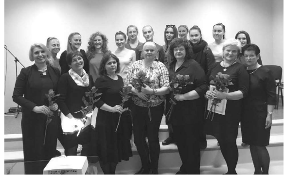
Pažangios slaugos klubo nariai

Po dvejų metų, 1983-iaisiais, ištekėjau ir atvykau į Klaipėdą. Dirbau tuometinės Respublikinės ligoninės (dabar – Klaipėdos apskrities ligoninė) kardiologiniame skyriuje. Po poros metų išėjau vaiko priežiūros atostogų. 1986 m. įsidarbinau Pirminiame sveikatos priežiūros centre, Mokyklų skyriuje. Dirbau Klaipėdos Baltijos mokykloje. 1990 m. gimė antra dukra. Po kelerių metų grįžau į darbą ir dešimt metų dirbau slaugytoja Klaipėdos 14-oje mokykloje (dabar – Ažuolyno gimnazija). Dirbdama šioje mokykloje įsitraukiau į Raudonojo Kryžiaus veiklą. Mokykloje įkūriau Raudonojo Kryžiaus būrelį, mokiau vaikus pirmosios pagalbos, kasmet