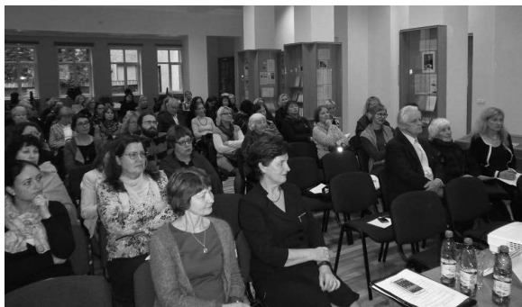
Konferencijos dalyviai.