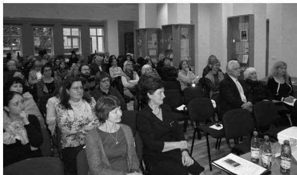
Konferencijos dalyviai.