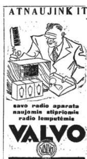
33 pav. Apžvalga 1936, 10: 8.