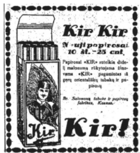
31 pav. Dienos naujienos 1932, 45: 3.