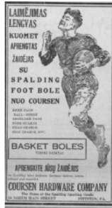
7 pav. Tėvynės balsas 1921, 3: 4.