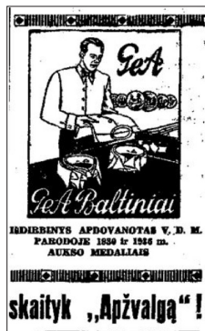
16 pav. Naujoji Romuva 1938, 15: 1; 6, 33.