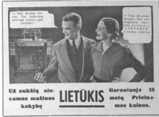
26 pav. Amatininkas 1937, 22: 20.