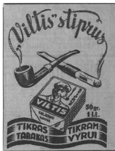
30 pav. Įdomus mūsų momentas 1938, 24: 4.