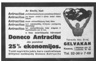
4 pav. Bangos 1932, 37: 36.