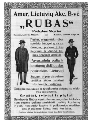
17 pav. Apžvalga 1939, 12: 6.

Sėkmę vyrų gyvenime, finansinį nepriklausomumą reprezentuoja ir automobiliai. Marshallas McLuhanas teigia, jog „<...> automobilis tapo aprangos dalimi, be kurios miesto aplinkoje jaučiamės netvirtai, tarsi būtume neapsirengę ir neišbaigti“ (2003: 213). Tarpukaryje automobilis taip pat reprezentavo vyro sėkmę, buvo svarbi pasitikėjimo savimi stiprinimo dalis. „Lincoln, Ford ir Fordson“ reklamos (18 pav.) tekstas Ir daugiausia reikalaujantis ras čia tinkamą jam vežimą reiškia tai, jog būtent čia automobilius perka didžiausius lūkesčius turintys vyrai. „MORRIS‘EIGHT“ reklamoje (19 pav.) šalia kostiumu apsirengusio vyro vaizduojama dama ir prabangus automobilis. Tai sėkmingos karjeros ir vyro heteroseksualumo ženklai.