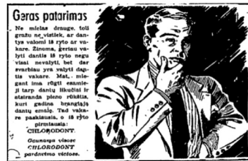
40 pav. Naujoji Romuva 1936, 15–16: 29. 41 pav. Naujoji Romuva 1934, 205–206: 27. 42 pav. Geležinkelininkas 1937, 1: 17.