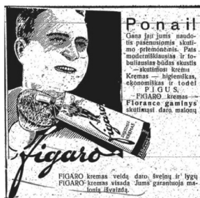
36 pav. Naujoji Romuva 1933, 156: 34.

Kitas vyro malonumas siejamas su muzikos klausymu, išprusimu, taip pat kokybišku įrenginiu. „Sieros“ radijo reklamoje (32 pav.) vyras, pridėjęs smilių prie lūpų, kitiems nurodo, ką jie turi daryti. Reklamos tekstas Cit! „Siera“ griežia nurodo mėgstančio vadovauti vyro poziciją. Jis nori pasinerti į muzikos teikiamą palaimą: Jo aiškus, gražus garsas ir puiki išvaizda gali sužavėti kiekvieną. „VALVO“ lempučių reklamoje (33 pav.) vaizduojamas savo radijo imtuvu besidžiaugiantis ir besirūpinantis džentelmenas. Jo paveikslas perteikia idėją, kad kokybiškos įrenginio dalys garantuoja malonumą. Sku-