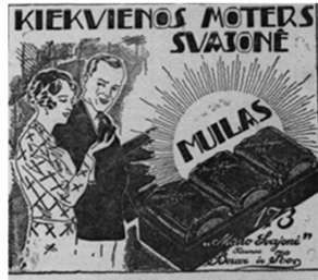
27 pav. Aš ir jūs 1931, 2: 50.