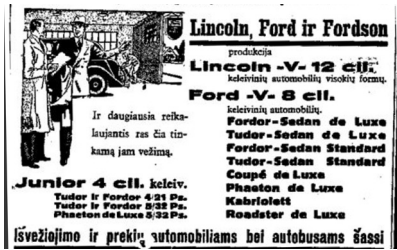
18 pav. Apžvalga 1936, 12: 6.