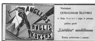
5 pav. Tėvų žemė 1934, 1: 10.