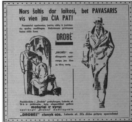
12 pav. Jaunoji karta 1938, 44: 23.