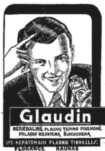
35 pav. Apžvalga 1938, 8–9: 11.