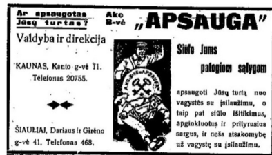
21 pav. Apžvalga 1938, 7: 12.