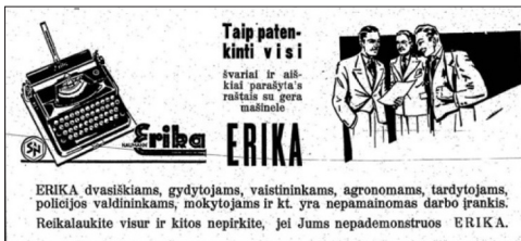
20 pav. Naujoji Romuva 1939, 37: 26.