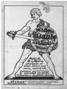
1 pav. Bangos 1932, 1: 36.

„Alyno“ reklamos (1 pav.) rimtai nusiteikęs herojus primena savimi pasitikintį, bebaimį senąjį lietuvių karį, jo kardas konotuoja ryžtą užkariauti pasaulį, tiesa, ne mūšyje, o geriant alų. Reklamos „Rungiasi graikų-romėnų imtynių TARPTAUTINIS ČEMPIONATAS“ (2 pav.) imtynininkai pavaizduoti kaip antikos laikų narsuliai, primenantys, kad nuo seniausių laikų tikrojo vyriškumo sampratos akcentai buvo narsa, ryžtas, bebaimiškumas, raumeningas kūnas. Elektromechanikos dirbtuvės „L.T.S.“ reklamoje (3 pav.) sportiškas vyras savo povyza ir žvilgsniu perteikia pasitikėjimą savimi, tad galima sakyti, kad garantuoja profesionalumą, gebėjimą atlikti daug tos srities darbų ir taip papildoma reklamos tekstą: taiso, pervynioja, remontuoja, įveda, stato, įrengia . „Gelvakan“ anglių (4 pav.) ir „Lietūkio“ Anglijos anglies reklamų vizualuose (5 pav.) galiūnų vaizdiniai žymi stiprybės, kantrybės ir gebėjimo atlikti daug pastangų reikalaujančią darbą charakteristikas. Šie hegemoninio vyriškumo bruožai išryškina vyrų pranašumą moterų atžvilgiu, byloja apie discipliną ir užsispyrimą.