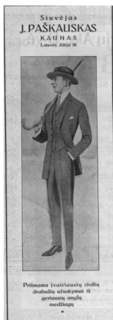
14 pav. Atspindžiai 1923, 3: 3.

drabužių siuvelyklų reklamų tekstai: geriausių anglų medžiagų (14 pav.), elegantiškus rūbus (15 pav.), apdovanotas V. D. M. parodoje 1880 ir 1936 m. aukso medaliais (16 pav.), Puikūs, elegantiški rūbai suteikia žmogui gerus draugus, padaro jį turtingesniu ir duoda laimės geresnei ateičiai (17 pav.). Taigi tarpukariu daug dėmesio buvo skirta vyro galiai, perteikiamai vizualia informacija – gražiais, kokybiškais, elegantiškais drabužiais besirengiantis vyras yra sėkmingas profesiniame gyvenime. Tai labai svarbus normatyvinio vyriškumo aspektas. Galima teigti, jog tarpukariu sąvoka „džentelmenas“ reiškė ne tik tam tikrą išvaizdos elementų darną, bet ir savybes, apibūdinančias vyriškumą. Šiuo atveju tai mandagumas, geras išsiauklėjimas, sąžiningumas. Tokia vyriškumo reprezentacija artima antikos laikų, Romoje susiklosčiusiai gero vyro (lot. vir bonus ) sampratai.