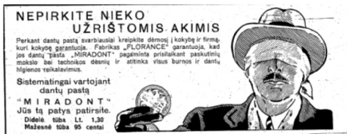
43 pav. Naujoji Romuva 1933, 156: 33.

liudija moneta jo rankose. Savaiame suprantama, kad rūpindamasis savo išvaizda, jis gerai atrodys ir bus tas pavyzdys, kuriuo norės sekti kiti.