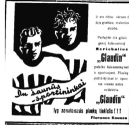
8 pav. Apžvalga 1938, 27: 7.

Itin glaudžiai susijusios sąvokos – vyriškumas ir sportas. Sportas leidžia demonstruoti puikų kūną ir fizinį pajėgumą, pabrėžti vyriškumą per jėgą ir galią, suteikia pasitikėjimo savimi ir skatina gerą nuotaiką, norą siekti pergalių („Lietūkiu“ alyvos reklama (6 pav.) ir „Coursen“ sportinių drabužių reklama (7 pav.)). „Glaudin“ reklamos (8 pav.) kūrėjai priėmė įdomų sprendimą – tekstu aprašoma plaukų priežiūros priemonė, o vizuale matomi sportuojantys vyrai. Taigi dėmesys kreiptinas ne tiek į pačią prekę ir tiesioginį jos poveikį, o į vyriškumą. Sandra Janulienė teigia, jog dažnai reklamose „adresatui siūlomas ne produktas, bet tam tikros vertės, galinčios patenkinti jo <...> poreikius“ (2008: 145). Reklamoje pavaizduotos sportinės aprangos, platūs pečiai, rimtos veido išraiškos – stereotipinę hegemonišką vyrą reprezentuojančios detalės.