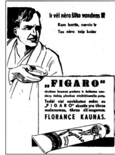
37 pav. Naujoji Romuva 1934, 188–189: 27. 38 pav. Naujoji Romuva 1935, 10: 2. 39 pav. Naujoji Romuva 1937, 44: 27.