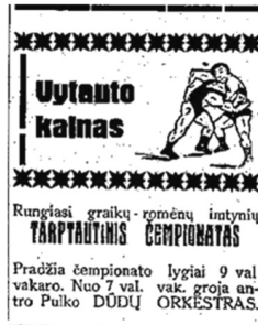
2 pav. Dienos naujienos 1931, 65: 4.