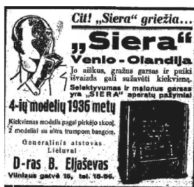
32 pav. Apžvalga 1935, 24: 8.