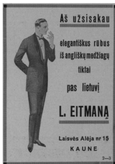
15 pav. Tautos vairs 1924, 1: 26.