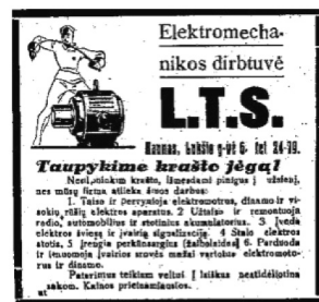
3 pav. Dienos naujienos 1932, 137: 4.