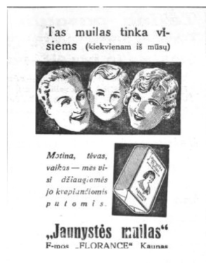
23 pav. Amatininkas 1938, 24: 22. 24 pav. Naujoji Romuva 1938, 25 pav. Naujoji Romuva 1935, 42: 24. 51–52: 36.