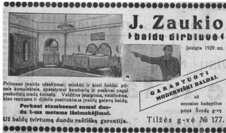
22 pav. Įdomus mūsų momentas 1933, 4: 5.