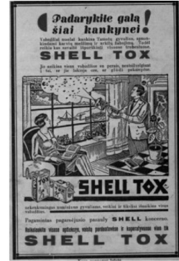
28 pav. Aš ir jūs 1931, 1: 52.

gyvenimo būdą, požiūrį į save, estetinį skonį (plg. Urbonienė 2007: 35). Džentelmenas suteikia saugumo jausmą moteriai rūpindamasis ja, dovanodamas dovanas, prieinamas ne kiekvienai (26 pav.). Muilo „Mano svajonė“ reklamos antraštė „Kiekvienos moters svajonė“ (27 pav.) pabrėžia, jog vyras savo damai suteikia tai, ko trokšta visos moterys. Jo mimika perteikia santūrumą, bet kartu ir paslėptą džiaugsmą savo pergale. „Shell-Tox“ reklamoje (28 pav.) vyras, kaip tikras džentelmenas, imasi ir namų ruošos darbų, taip palengvindamas moteriai buitį.