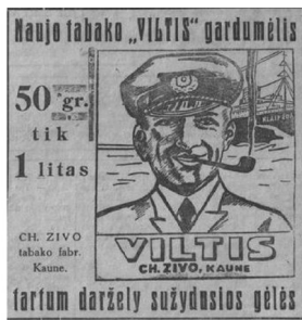
29 pav. Įdomus mūsų momentas 1938, 15: 4.