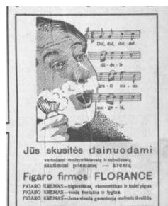
34 pav. Naujoji Romuva 1934, 161: 27.