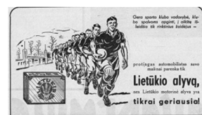
6 pav. Akademikas 1938, 10: 2.