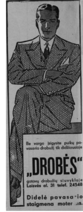
9 pav. Akademikas 1938, 10: 28. 10 pav. Jaunoji karta 1938, 6: 22. 11 pav. Jaunoji karta 1938, 16: 24.