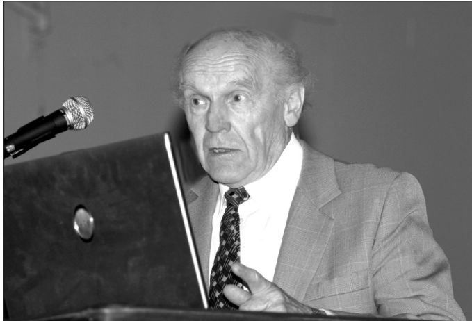
Tarptautinėje konferencijoje, skirtoje filosofijos Lietuvoje 500 metų sukakčiai, 2007 m. Būtent Profesoriaus atlikti tyrimai atskleidė šios sukakties faktą. Jis buvo konferencijos Mokslinio komiteto pirmininkas.