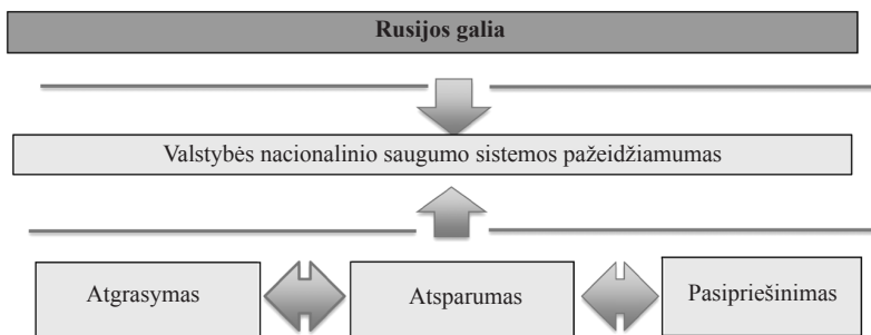
1 pav. Rusijos galios projekcija į valstybę – taikinį