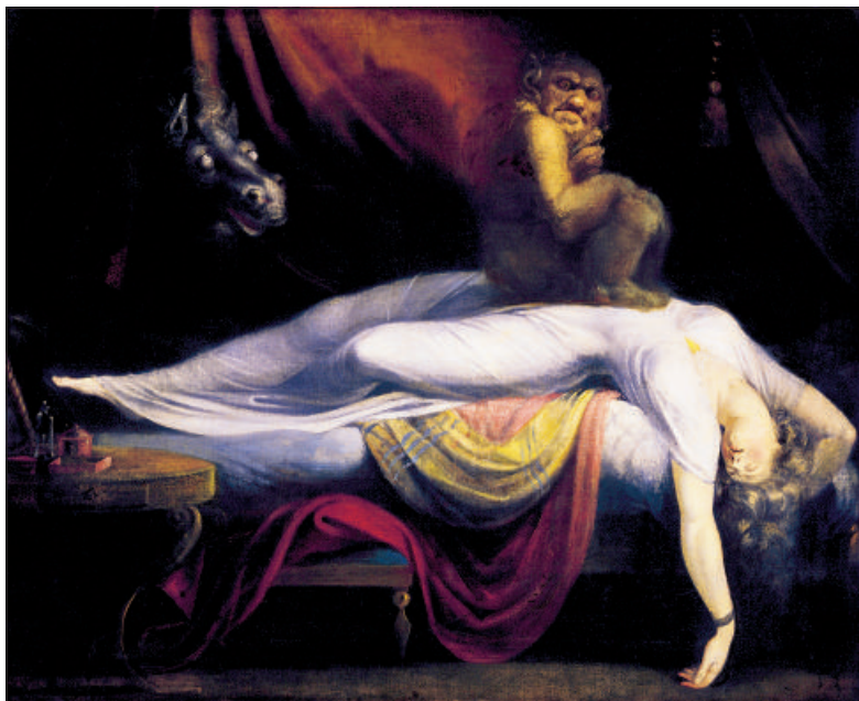
1 pav. Henrio Fuselio (Henry Fuseli; 1741–1825) drobė „Košmaras“ (1781 m.). Paveiksle, vertinant šių dienų neurologo akimis, pavaizduotas miego paralyžius su krūtinės spaudimu ir regos haliucinacijomis (inkubo fenomenas).

Epizodas dažniausiai lydimas piloerekcijos, tachikardijos, pakilusio arterinio kraujospūdžio, dusulio jausmo, išpylimo šaltu prakaitu, seksualinio susijaudinimo ar net mirties baimės [1]. Izoliuotas inkubo fenomenas būdingas REM parasomnijai, tačiau, jei inkubo fenomenas pasireiškia kartu su pataloginiu mieguistumu dieną, katapleksijos epizodais, šis simptomas yra narkolepsijai būdingas požymis.