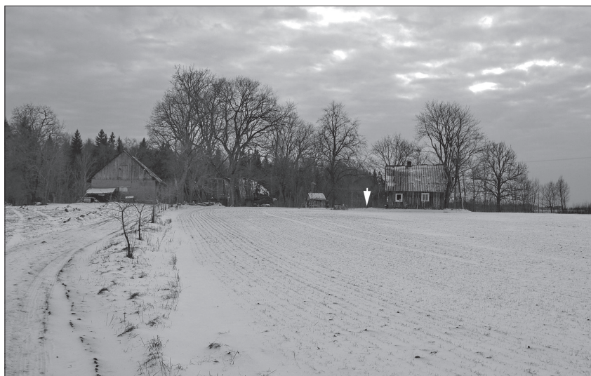
3 pav. Dambruskų sodyba – Dvarninkų kaimo viensėdis, žvelgiant iš šiaurės. Paženklinta bunkerio vieta nugriautoje gyvenamojo namo pusėje. 2014 m. vasario 1 d.