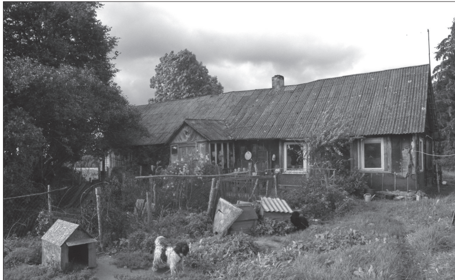
5 pav. J. Martinaičio gyvenamasis namas Kaneivaičių kaime, žvelgiant iš pietų. Mokykla veikė namo rytinėje dalyje, nuotraukos dešinėje. 2014 m. rugpjūčio 25 d.