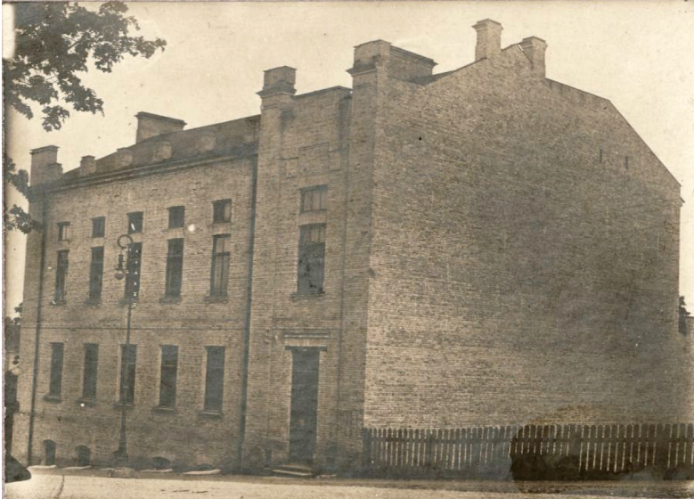
3 iliustracija. P. 1. „Dienos prieglaudos pastatas“.