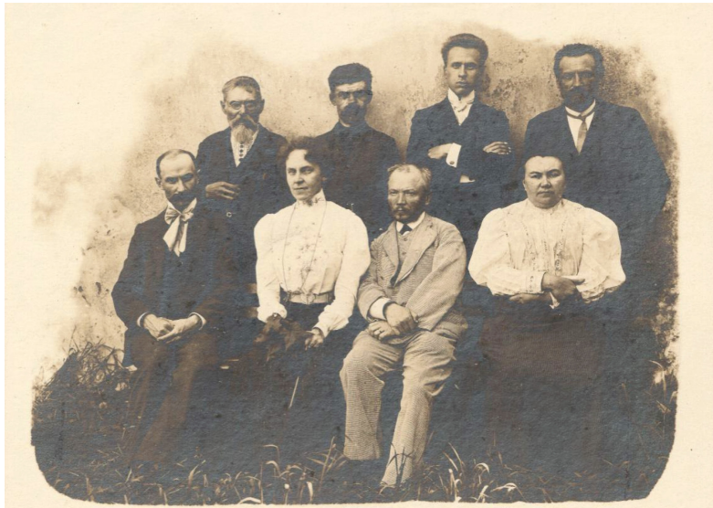
13 iliustracija. P. 11. „Personalas“.