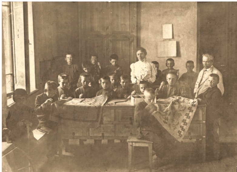
7 iliustracija. P. 5. „Siuvimo dirbtuvės“.