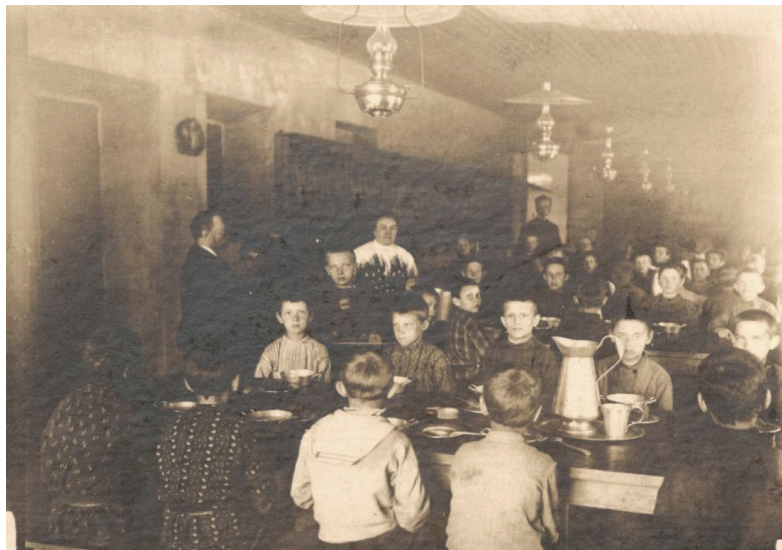
11 iliustracija. P. 9. „Valgomajame“.