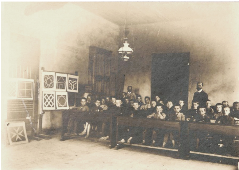
4 iliustracija. P. 2. „Klasėje“.