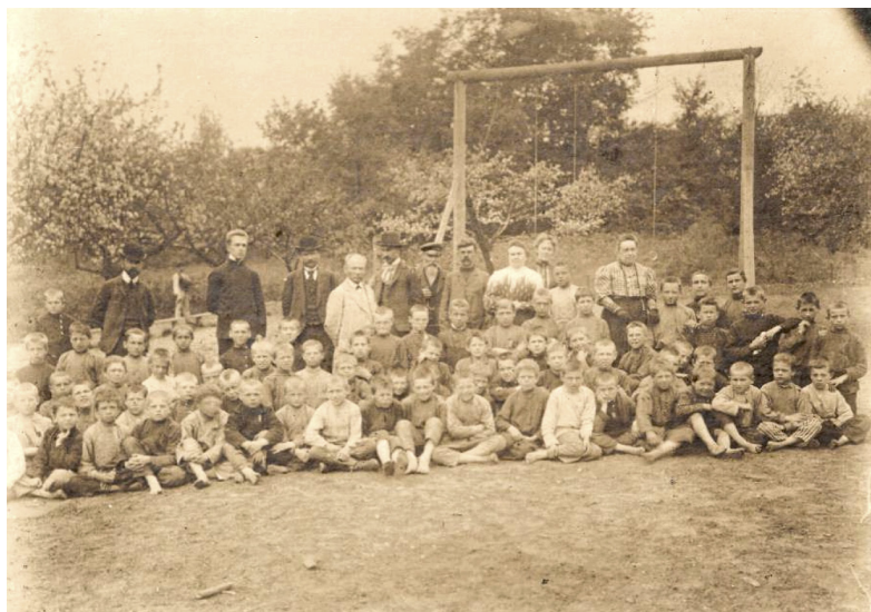
12 iliustracija. P. 10. „Grupė sode“.