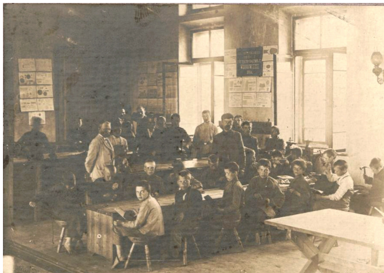
8 iliustracija. P. 6. „Batsiuvių ir šaltkalvystės dirbtuvės“.