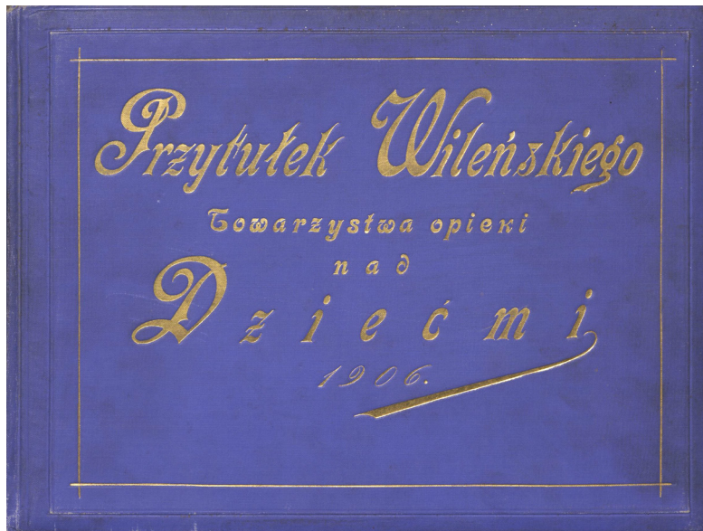
1 iliustracija. Viršelis. „Vilniaus vaikų globos draugijos dienos prieglauda 1906“.