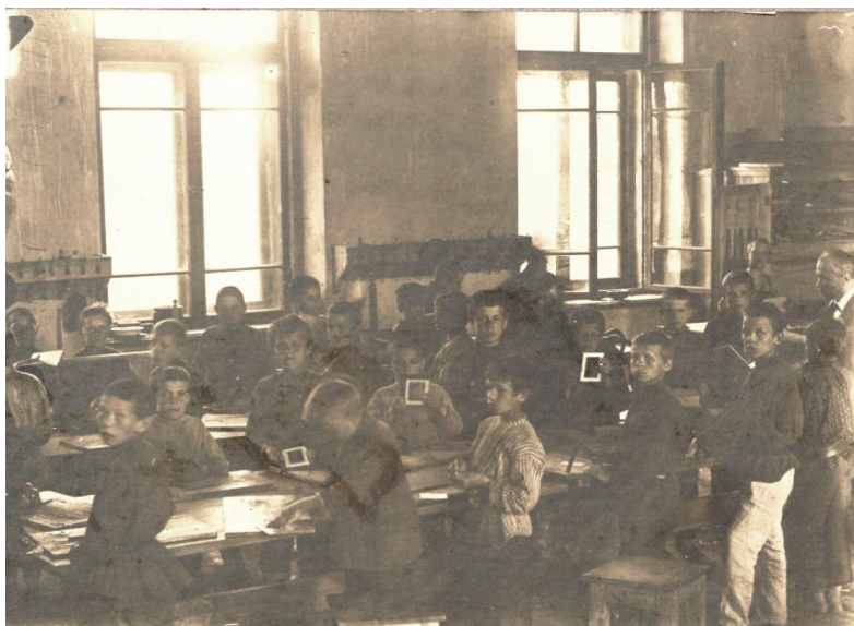
6 iliustracija. P. 4. „Knygrišystės dirbtuvėse“.