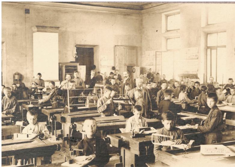
5 iliustracija. P. 3. „Staliaus dirbtuvėse“.