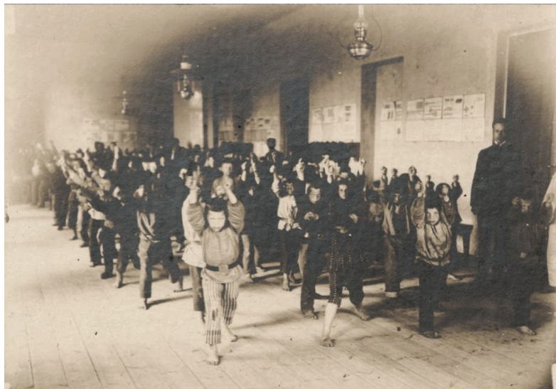
9 iliustracija. P. 7. „Švediška gimnastika“.