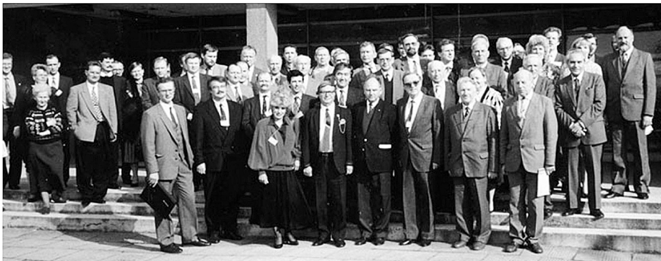
Pirmosios Lietuvos proktologų konferencijos Kaune dalyviai 1993 m.