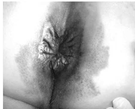
3 pav. Paburkusi išangės srities oda praėjus parai po metileno mėlio suleidimo