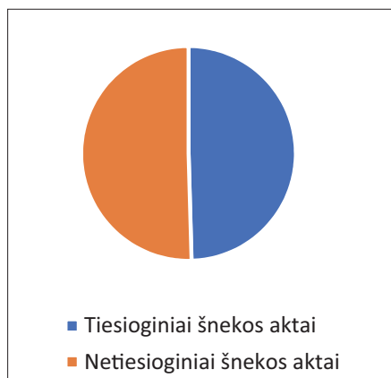
1 paveikslas. Įvaizdžiai grėsmingų Š.A. pasiskirstymas debatuose