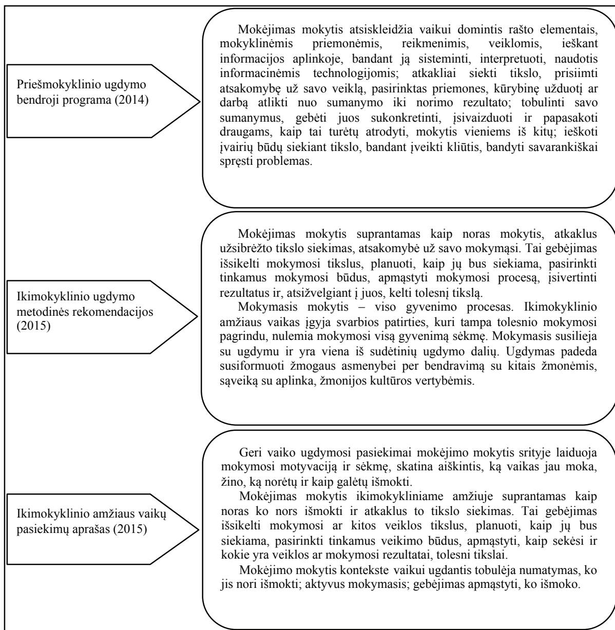
2 pav. Mokėjimas mokytis ikimokyklinį ugdymą Lietuvoje reglamentuojančiuose dokumentuose

Šiandien ikimokyklinio ir priešmokyklinio ugdymo organizavimą reglamentuoja naujai parengti trys dokumentai (žr. 2 pav.), kuriuose išskirtinis dėmesys kreipiamas į vaikų mokėjimo mokytis ugdymą(si). Šiuose dokumentuose pateikiama mokėjimo mokytis samprata ir komponentai ( gebėjimas išsikelti mokymosi tikslus, planuoti, kaip jų bus siekiama, pasirinkti tinkamus mokymosi būdus, apmąstyti mokymosi procesą, įsivertinti rezultatus ir atsižvelgiant į juos kelti tolesnį tikslą ), mokymuisi mokytis svarbios sąlygos (bendradarbiavimas, savarankiškumas ir kūrybiškumas, veiklos įvairovė, noras mokytis, atsakomybė už veiklos rezultatus ir pan.), akcentuojama mokėjimo mokytis gebėjimo įtaka sėkmingam ateities mokymuisi.