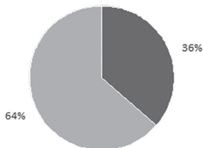
1 pav. 1951 m. rugsėjo mėn. iš Eišiškių r. ištremtų partizanų ir jų rėmėjų tautinė sudėtis

■ Lenkai (12 žmonių) ■ Lietuviai (21 žmogus)