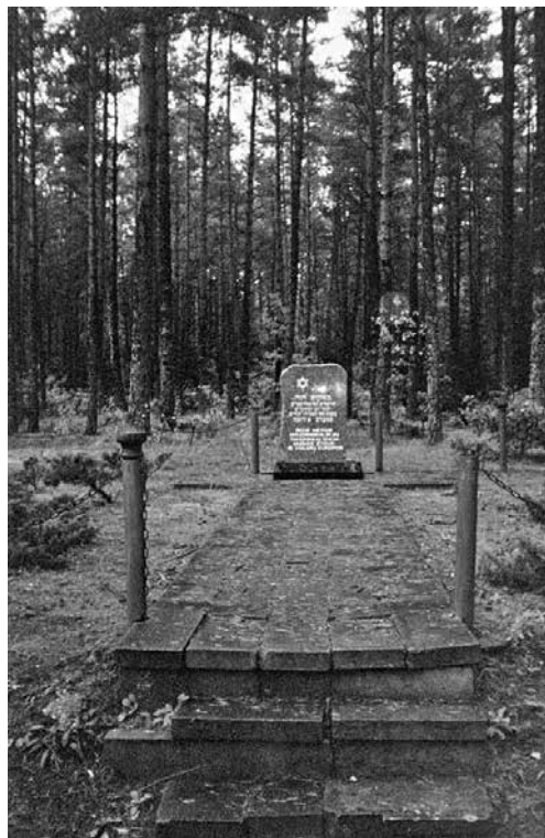
6 pav. Paminklas Pravieniškėse, kurį šio kaimo gyventojai pastatė nužudytiems žydų profesoriams iš Sorbonos.