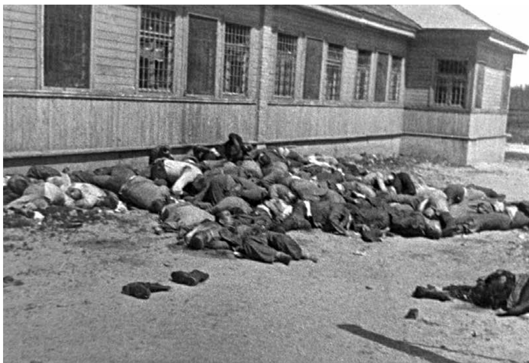
1–2 pav. Stovyklos ir besitraukiančių sovietų karių įvykdytų žudynių Pravieniškėse aukų vaizdas.