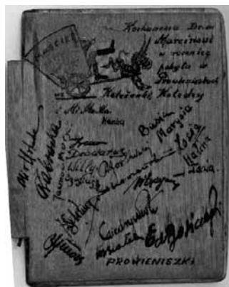
4 pav. Pravieniškių stalių dirbtuvių darbuotojo pagaminta medinė papirosų dėžutė su kalinių įrašais ir graviūra, vaizduojančia stovyklos sargybinius stomatologo kabinete, įteikta gydytojui Marciniui Błaszczakui