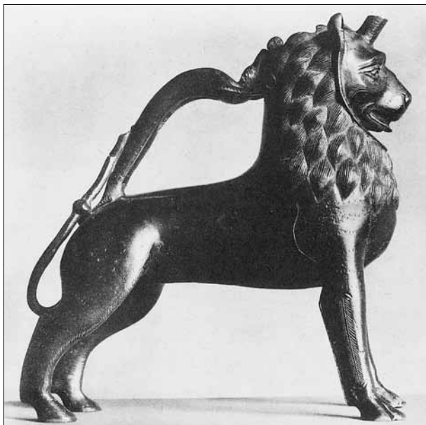
3 pav. Bartkuškyje rasta liūto formos akvamanilė (Falke, Meyer, 1935, S. 171, pav. 404)