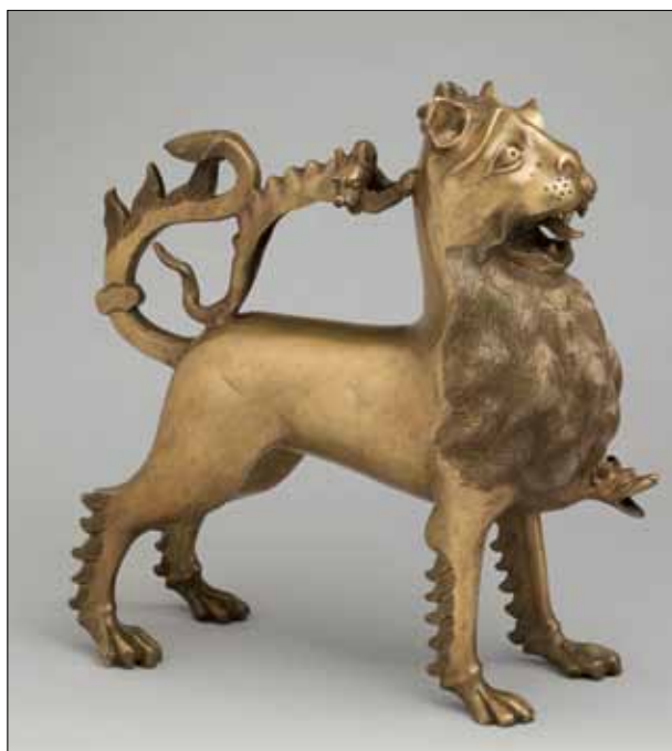
2 pav. a) romaninio laikotarpio; b) ankstyvosios gotikos; c) vėlyvosios gotikos; d) liepsnauodegės akvamanilės (Barnet, Dandridge, 2006, p. 67, pav. 1; p. 96, pav. 8; p. 107, pav. 11; p. 142, pav. 20)