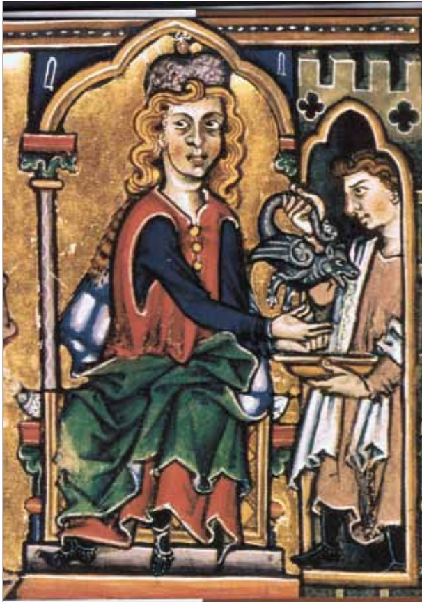
1 pav. Pontijus Pilotas plaunasi rankas. Bonmonto psalmynas, Vokietija, XIII a. (Barnet, 2006, pav. I-I)

Fig. 1. Pilate washing his hands. Psalter of Bonmont, 13th century (Barnet, 2006, Fig. I-I)