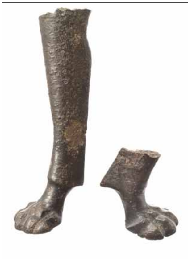
4 pav. Vilniaus Žemutinėje pilyje rastos liūto formos akvamanilės fragmentai. Inv. Nr. 4747, 4748 (Lietuvos, 2012, p. 95)

Fig. 4. Fragments of a lion aquamanile found in Vilnius Lower Castle. Inv. No 474, 478 (Lietuvos, 2012, p. 95)