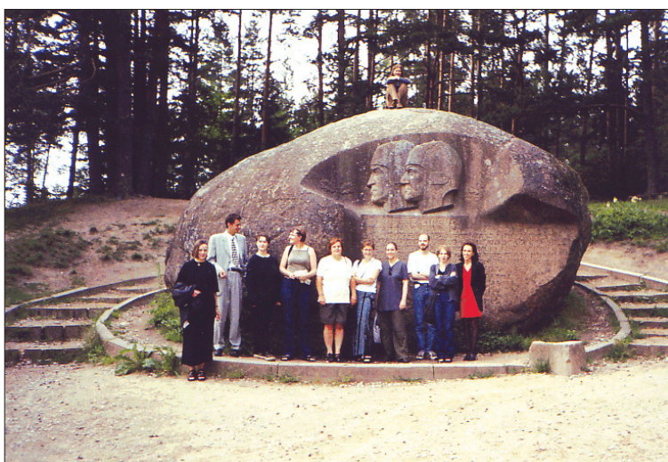
4 pav. Ekspedicijos dalyviai prie Puntuko akmens