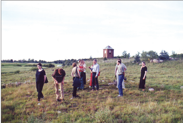
5 pav. Ekspedicijos dalyviai Žvainių pilkapyne