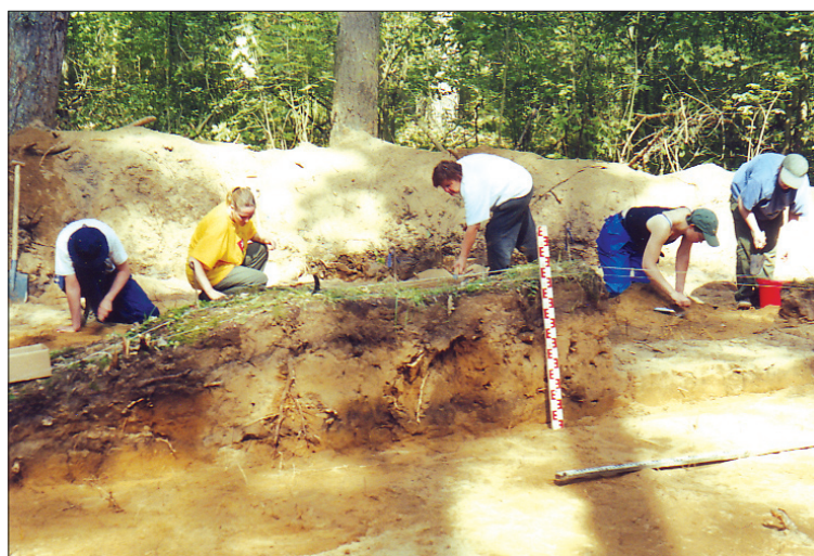
2, 3 pav. Jakšiškio pilkapyno archeologiniai kasinėjimai