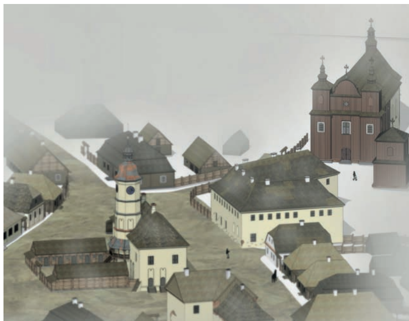
3 pav. Hipotetinis Merkinės centrinės aikštės vaizdas su miesto rotuše bei dominikonų konvento pastatais XVIII a. antroje pusėje

Fig. 3. Hypothetical view of Merkinė's central square with the town hall and the buildings of the Dominican convent in the second half of the 18 th century.