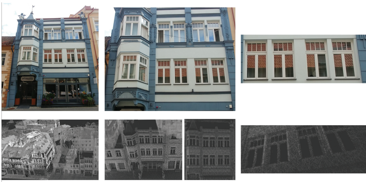
3 pav. Vilniaus ir Kauno senamiesčių pastatų fasadų 2D ir 3D atvaizdai