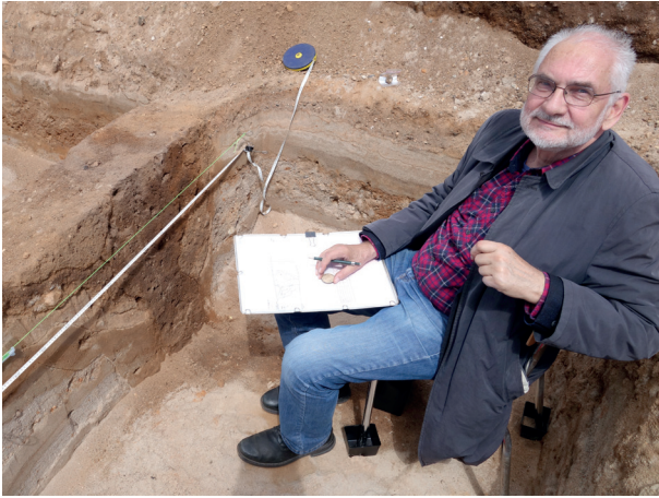
Kasinėjimai Jutlandijoje, 2015 metų vasarą