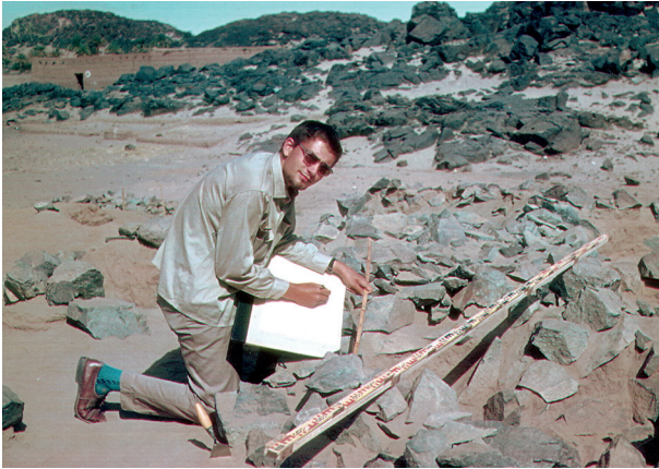
K. Randsborgas kasinėjimuose Sudane, 19 metų