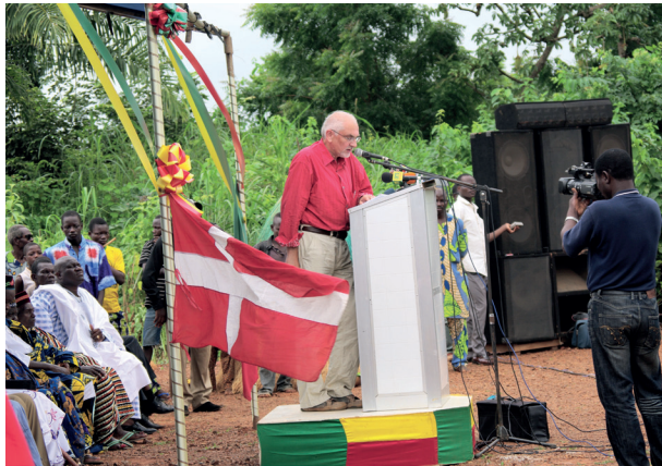
K. Randsborgas Benine, Agongointo'e, atidaro muziejų po atviro dangumi