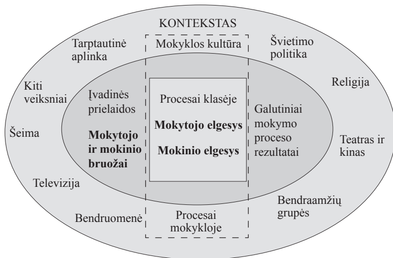
4 pav. Šiuolaikinis požiūris į mokymo procesą