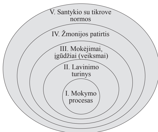
2 pav. Lavinimo turinio struktūra

žmonėmis forma. Kadangi asmenybė formuojama ne tik veiklos, bet ir bendravimo procese, mokant būtina derinti šiuos veiksnius (1985). Taigi procesas aprašomas kaip mokytojo ir mokinio veikla, bendravimas, kai dėmesys telkiamas į mokymąsi kaip svarbiausią komponentą. Reikšminga, kad autorius atsisakė mokymo kaip vienpusiškos mokytojo veiklos vyravimo supratimo ir ėmė traktuoti jį kaip abipusę mokytojo ir mokinio pedagoginį poveikį.