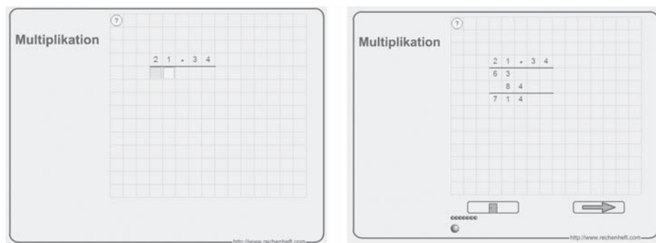
1 pav. Skaičių dauginimo būdas „Rechenheft“ programoje (Austrija).