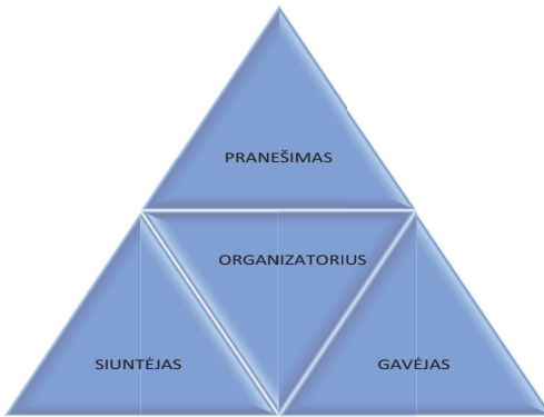
3 pav. „Organizatorius“ – veiksnys, išplečiantis komunikaciją tarp siuntėjo, gavėjo ir pranešimo, keičiantis ir galintis keisti komunikacijos modelio vaidmenis

priversti (pa/į)tikėti nežinant tikrojo siuntėjo. Šio komunikacijos proceso negalėtume apibūdinti kaip informacijos mainų, nors pats procesas gali būti organizuotas taip, kad auditorijos šitaip manytų.