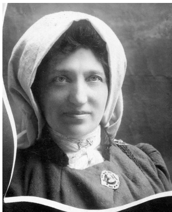
Pirmoji Lietuvoje fotografė moteris – Paulina Mongirdaitė.